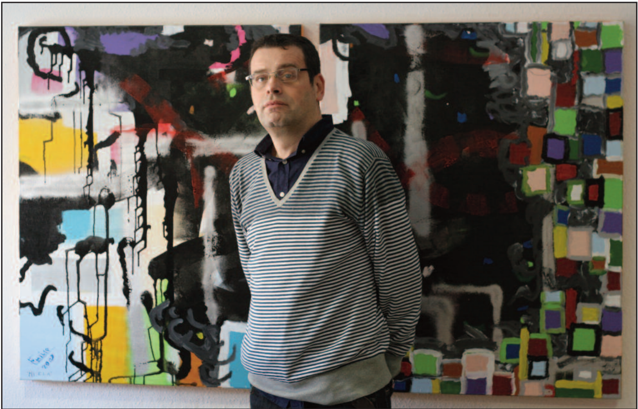
“Mi ELA”, El cuadro que le motivó a retomar los pinceles tras abandonar su gran pasión durante años.

En el momento de retomar los pinceles en enero de 2009 tenía casi paralizados totalmente los miembros superiores, empezaba a tener problemas con el habla, cansancio al caminar... Sus cuadros los realizaba con la boca y con el escaso movimiento que le quedaba en la la mano derecha ayudado por el empuje de la mano izquierda. Debido a la debilidad muscular de esta enfermedad, ya que poco a poco los músculos se van paralizando y cada esfuerzo es irrecuperable, cada cuadro lleva impregnado un trozo de vida. Optimismo, esperanza y ganas de vivir se mezclan en sus lienzos con la desesperación de la dura realidad.